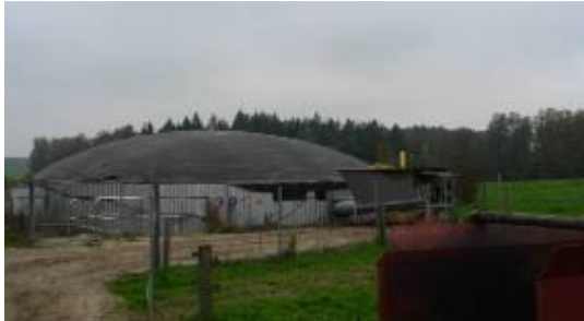
Abbildung 3. Fermenter und Einbringung der Biogasanlage Käsacher.

Exkursionsbetrieb I: Hr. Käsacher: Mairbach 3, 835343 Rott am Inn +49 8039 1435