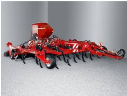
Abbildung 2. Kombination aus Schwergrubber Tiger und Sämaschine Pronto von Horsch zur gleichzeitigen Aussaat von z.B. Getreide, Raps, Gras oder Zwischenfrüchten bei der Bodenbearbeitung.

Je Zwischenfrucht wird der Boden ca. 30 cm tief gelockert und im gleichen Arbeitsgang ca. 100 kg N über Biogasgülle zusammen mit dem Saatgut ausgebracht (Holmer Terra Dos mit Tiger Pronto, Abbildung 2)