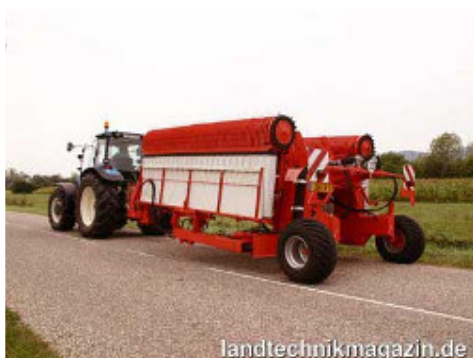
Abbildung 1. Bandschwader in Arbeitsstellung (links oben), Transportstellung (links unten) und beim praktischen Einsatz.