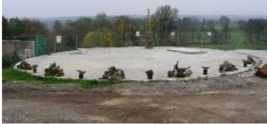
Abbildung 5: Fermenter (oben) und Gaslager im Container (unten) der Biogasanlage Zehetmair.

Exkursionsbetrieb III: Fr. Zehetmair: Angerfeldweg 1, Schechen +498031 5413