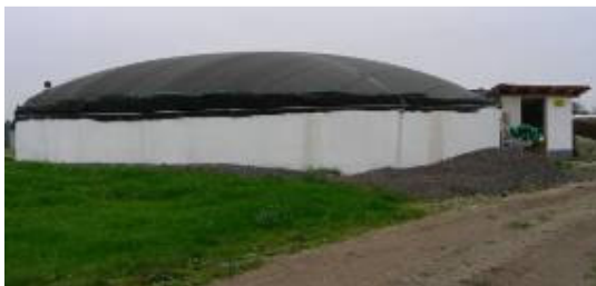
Abbildung 4. Fermenter der Biogasanlage Gaißinger.

Exkursionsbetrieb II: Hr. Gaißinger, Ritzmehring, 835343 Rott am Inn +49 8039 1394