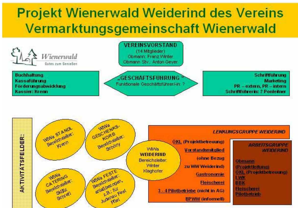
Abbildung: Neustrukturierung der Vermarktungsgemeinschaft

LOISKANDL spricht über das neue Organsiationsschema der Vermarktungsgemeinschaft Wienerwald (Vergleiche obige Abbildung):