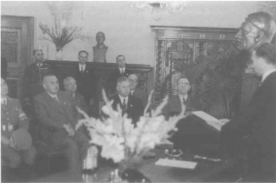
Empfang in den Räumen des Oberbürgermeisters. Als Dekoration dienen neben der Adolf-Hitler-Büste auch Antiquitäten des Stiftes Göttweig.