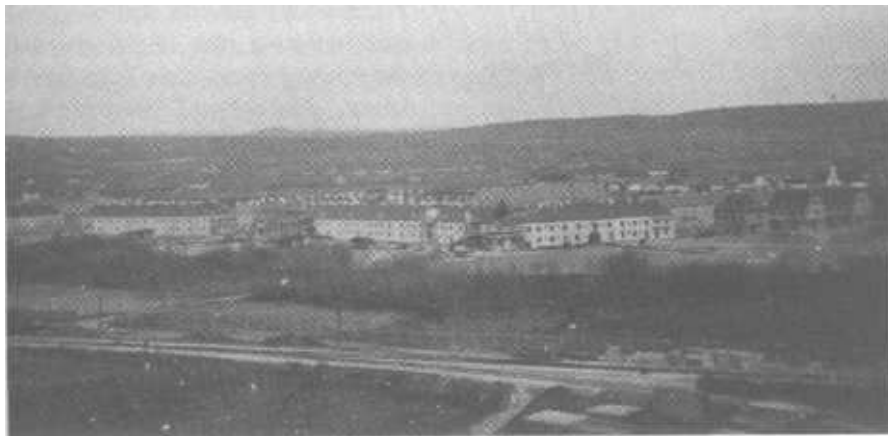
Der Bau des Walzwerkes in Lerchenfeld mit einer vorbildlichen Wohnhausanlage