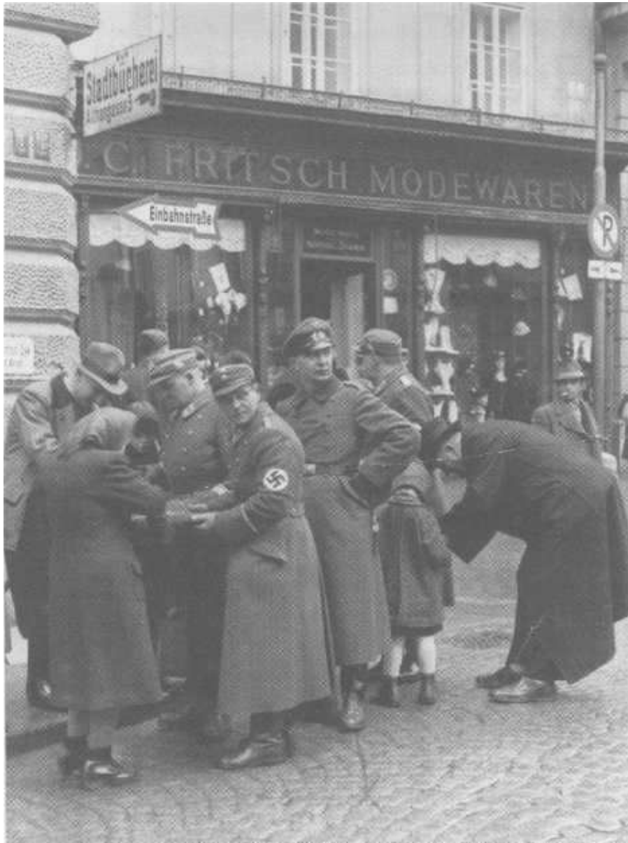
Straßensammlung für das Kriegswinterhilfswerk in der Landstraße in Krems