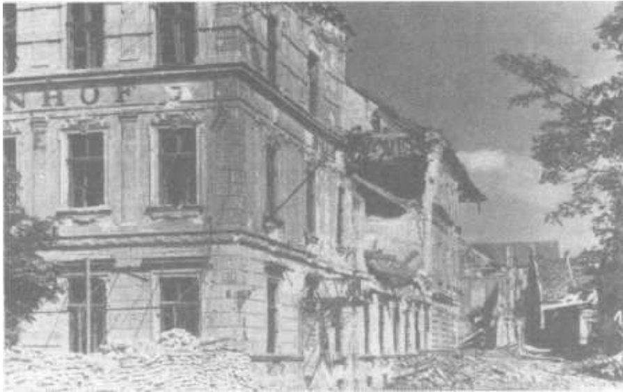
Vom Bahnhof und den umliegenden Häuserzeilen blieb nur ein Trümmerhaufen