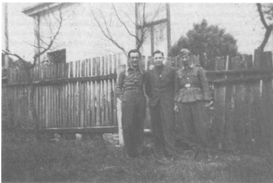
Ein slowenischer Kriegsgefangener in Gneixendorf bei der Arbeit Gruppenbild mit Kriegsgefangenem (l.v.r.): Ende 1944 bereits möglich