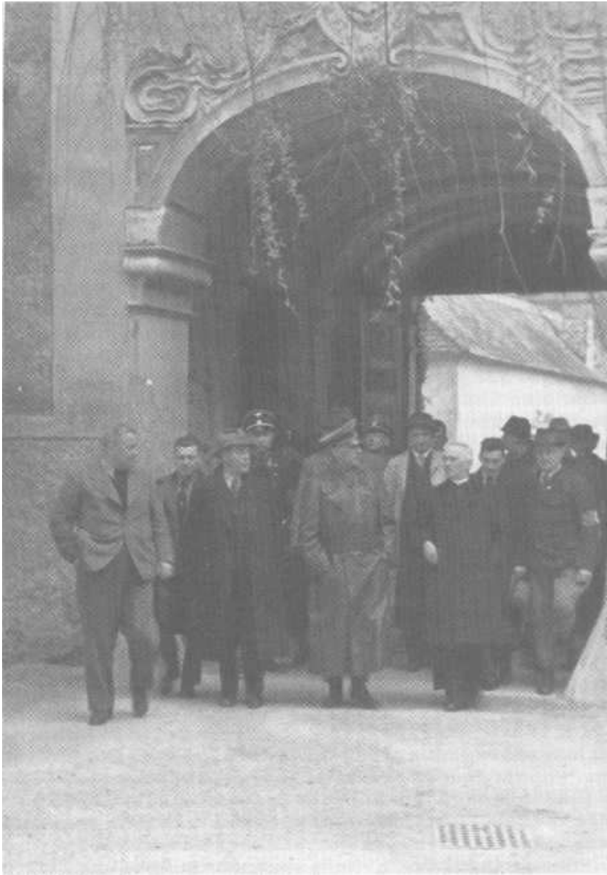
Arrangement mit der Macht Empfang von Parteigrößen im Stift Dürnstein durch den Pfarrer