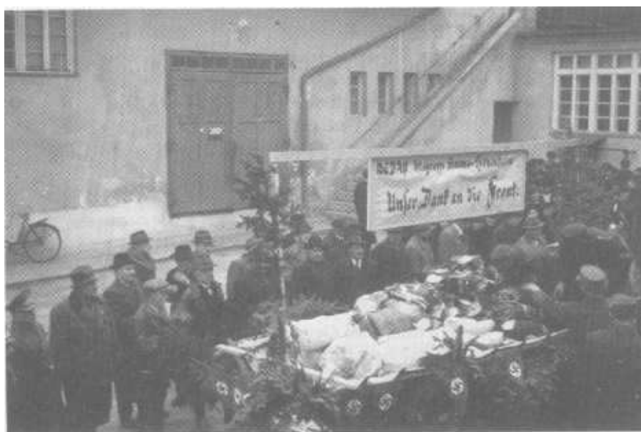
Tannenreisig ohne Begeisterung: Sammlungen für die Front in den Straßen der „Gauhauptstadt“ Krems