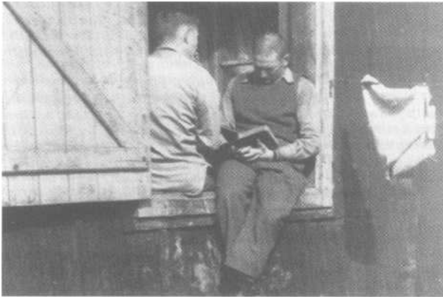
Der amerikanische Sektor des Kriegsgefangenenlagers Stalag 17B