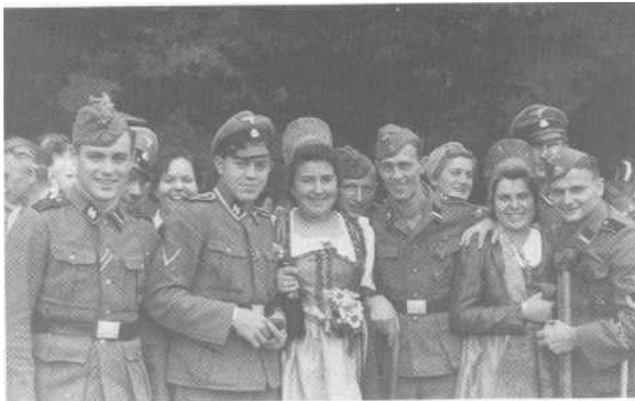
Betreuung der Kriegsversehrten in Dürnstein: eine Aufgabe des Heimatlandes und der Frauen