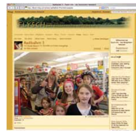
Nah, unmittelbar, lebendig – das ist Web 2.0! Sehen und gesehen werden: die Mitgliederseiten