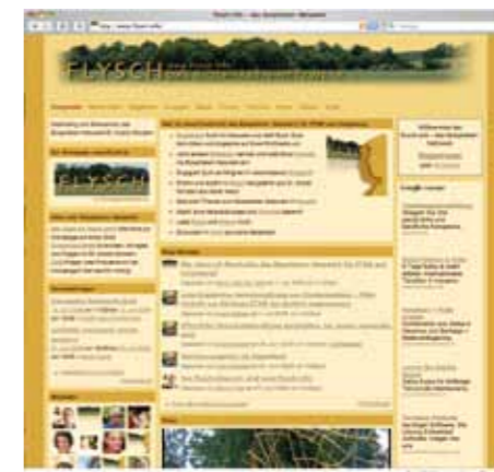
Eine Art Facebook für St. Andrä-Wörtern: www.flysch.info

Das Biosphären-Netzwerk bietet nachhaltigen Initiativen eine